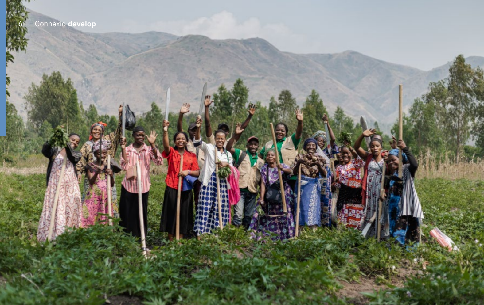
Frauen verschiedener Ethnien bei der gemeinsamen Feldarbeit in Uvira, DR Kongo. Was als Friedensarbeit begann, wurde zu echter Freundschaft.