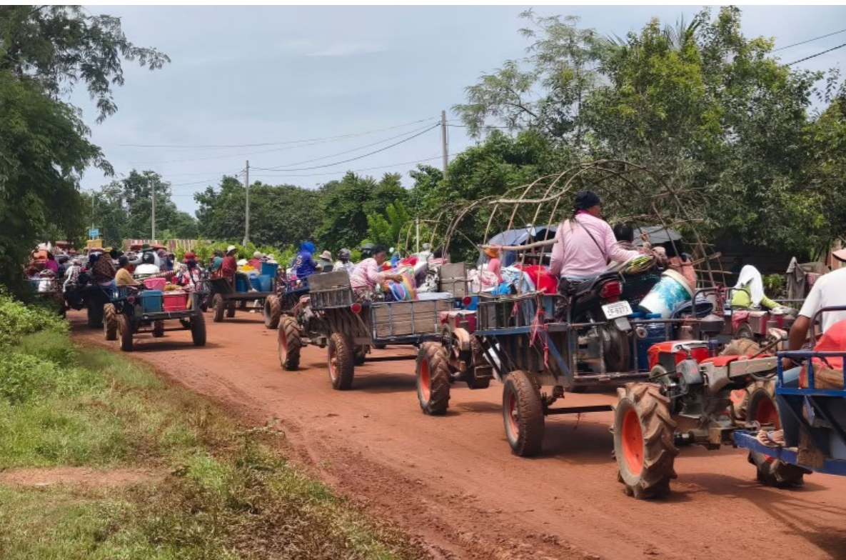
Kambodschanische Familien, die im Juli 2025 mit ihren Traktoren aus dem Grenzgebiet fliehen.

Die Rebellengruppe M23 hat im Osten der Demokratischen Republik Kongo grosse Gebiete eingenommen und die humanitäre Lage weiter verschlimmert. Hunderttausende Menschen wurden aus ihren Häusern vertrieben – obschon im Juni 2025 ein Friedensabkommen in Washington unterzeichnet wurde. Unsere Partnerorganisation, die Episkopalregion Ost-Kongo, ist stark in der Region verwurzelt und genießt Vertrauen bei den Menschen und lokalen Behörden. Unterstützt von Connexio develop leistete sie in Goma, Bukavu und Uvira Nothilfe und erreichte insgesamt 3'800 Personen.