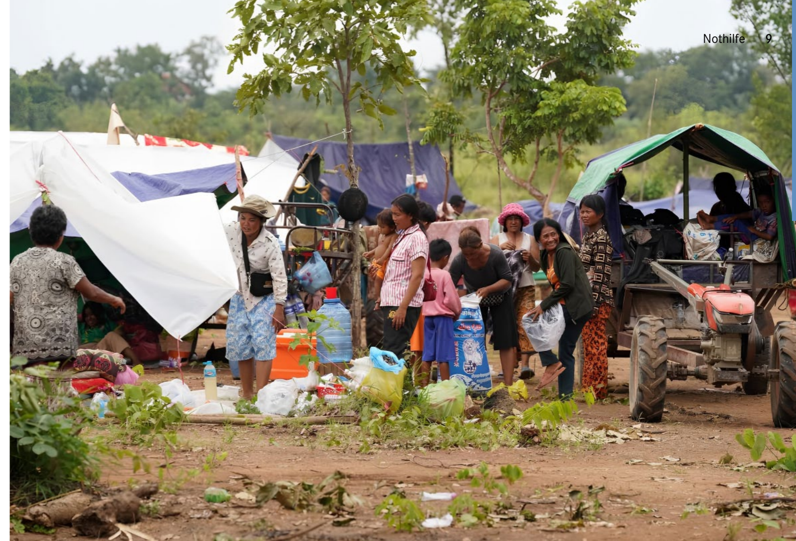
Vertriebene Familien haben ein provisorisches Lager errichtet. Seit Juli 2025 unterstützt Connexio develop mit lokalen Partnern in Kambodscha die Verteilung von Nahrungsmitteln und Gütern des täglichen Bedarfs.

Insbesondere Witwen und Waisen leiden unter den seelischen Folgen des Krieges. Über das europäische Netzwerk der Methodistenkirchen entstand eine Zusammenarbeit mit Fachpersonen, die in der Westukraine ein Zentrum für psychosoziale Unterstützung und Seelsorge aufgebaut haben. Connexio develop unterstützte im vergangenen Jahr einen zehntägigen Erholungsaufenthalt für 50 Personen.